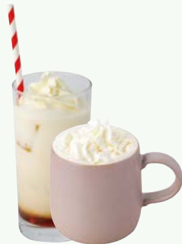
ロイヤルミルクティー (Hot / Iced) ROYAL MILK TEA 770