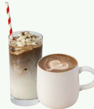
ほうじ茶ラテ (Hot / Iced) HOJICHA LATTE 770