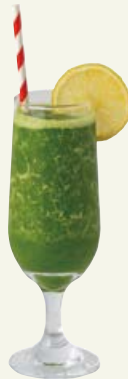
グリーンスムージー GREEN SMOOTHIE