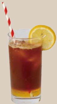
エスプレッソレモネード ESPRESSO LEMONADE