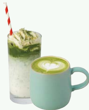
抹茶ラテ (Hot / Iced) MATCHA LATTE 770