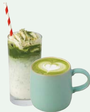
抹茶ラテ (Hot / Iced) MATCHA LATTE 770