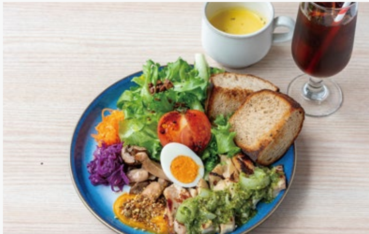
ブランチプレート バジルと新玉ねぎのソース 1980 (スープ・ドリンク付き)

BRUNCH PLATE BASIL & ONION SAUCE / SOUP / DRINK