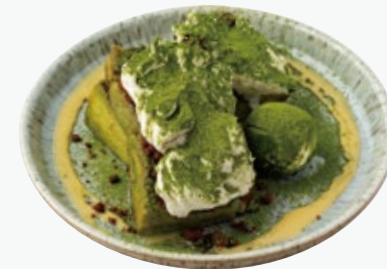
抹茶ティラミスの フレンチトースト 1760 MATCHA FRENCH TOAST

アレルギー：くるみ、小麦、卵、乳 Allergens : walnuts, wheat, eggs, dairy