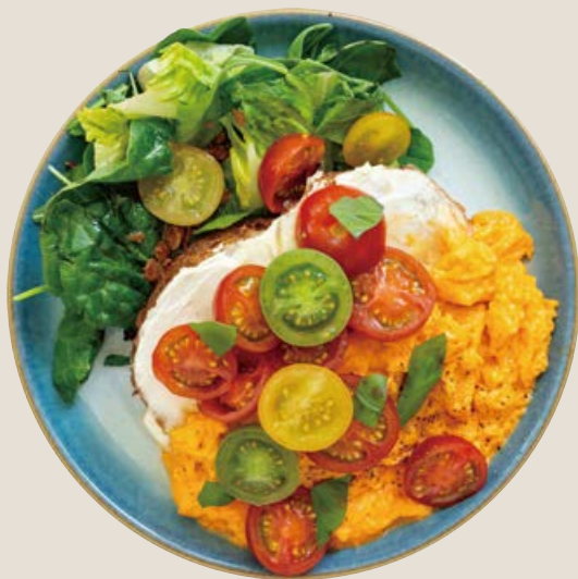
トマトとマスカルポーネのオープンサンド (ドリンク付き)