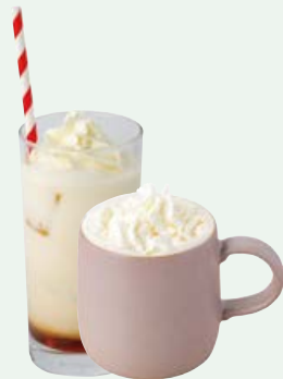
ロイヤルミルクティー (Hot / Iced) ROYAL MILK TEA 770