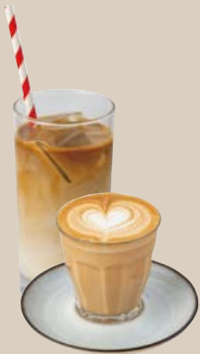
カフェラテ (Hot / Iced) CAFE LATTE 700