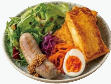
ソーセージのミール フレンチトーストプレート 1760 SAUSAGE MEAL FRENCH TOAST PLATE