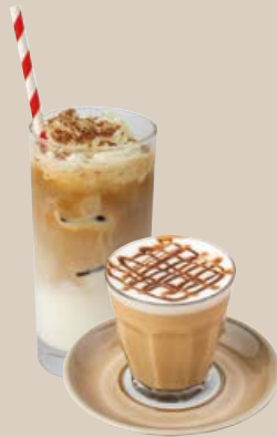
カフェモカ (Hot / Iced) CAFE MOCHA 770