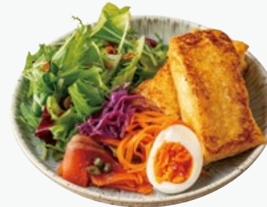
スモークサーモンのミール フレンチトーストプレート 1760 SMOKED SALMON MEAL FRENCH TOAST PLATE

アレルギー：くるみ、小麦、卵、乳 Allergens : walnuts, wheat, eggs, dairy