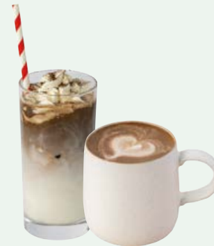
ほうじ茶ラテ (Hot / Iced) HOJICHA LATTE 770