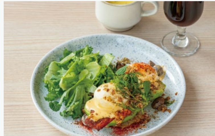
アボカドエッグベネディクト 1760 (スープ・ドリンク付き)

アレルギー：くるみ、小麦、卵、乳、落花生 Allergens : walnuts, wheat, eggs, dairy, peanuts