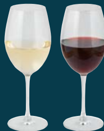
ワイン (赤/白) WINE (RED/WHITE)