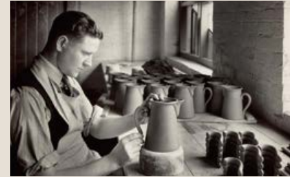
土にこだわった英国食器

A café you stumble upon while traveling. The terrace bathed in sunlight, the rich aroma of coffee brewed with care by the barista, and the simple, natural sourdough bread made from just flour and water. People relax at their own pace, all within an atmosphere that respects nature and embraces sustainability. Australian café culture isn't just a place to eat—it's a space for "enjoying a comfortable time." A morning coffee, a healthy lunch, and a leisurely afternoon with seasonal sweets. In this setting, there's an effortless yet refined lifestyle that breathes life into the experience. This sense of comfort and tranquility is what we wanted to bring to Japan, and from that vision, "Tsuchi" was born. Aiming to be a place where every visit makes you think, "I want to visit again." Enjoy a special moment at "Tsuchi."