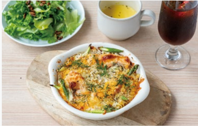
サーモンとアスパラガスのグラタン 1980 (サラダ・スープ・ドリンク付き)

SALMON AND ASPARAGUS GRATIN SALAD / SOUP / DRINK