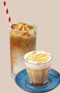
キャラメルラテ (Hot / Iced) CARAMEL LATTE 770