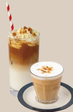
ヘーゼルナッツラテ (Hot / Iced) HAZELNUT LATTE 770

[ミルクの変更 +50] 豆乳 / オーツミルク [MILK SUBSTITUTE +50] SOY MILK / OAT MILK