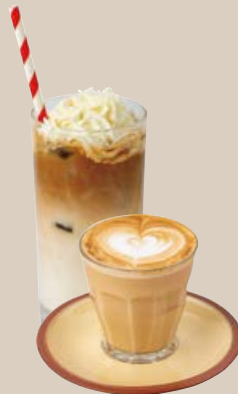
バニララテ (Hot / Iced) VANILLA LATTE 770