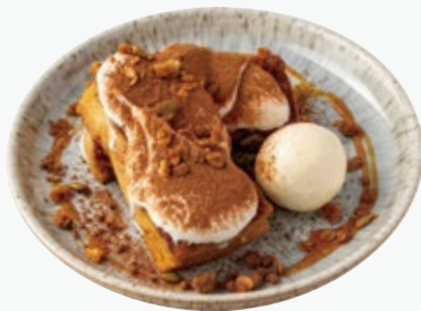
ティラミスの フレンチトースト 1540 TIRAMISU FRENCH TOAST

アレルギー：くるみ、小麦、卵、乳 Allergens : walnuts, wheat, eggs, dairy