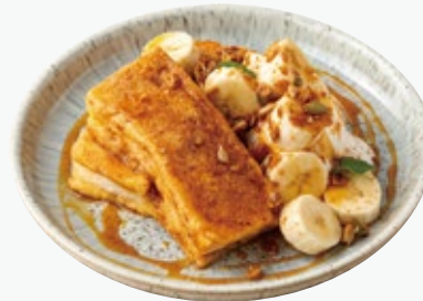
シナモン香るバナナの フレンチトースト 1430 CINNAMON BANANA FRENCH TOAST

アレルギー：くるみ、小麦、卵、乳 Allergens : walnuts, wheat, eggs, dairy