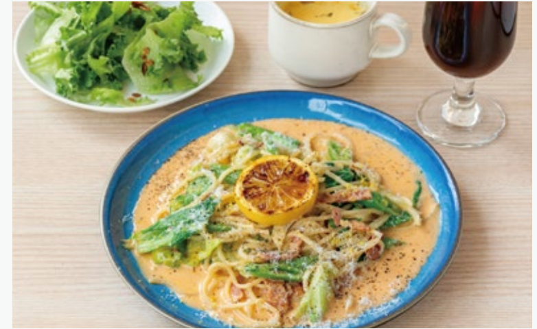
蘭王たまごと春野菜のレモンカルボナーラ 1760 (サラダ・スープ・ドリンク付き)

アレルギー：くるみ、小麦、乳 Allergens : walnuts, wheat, dairy